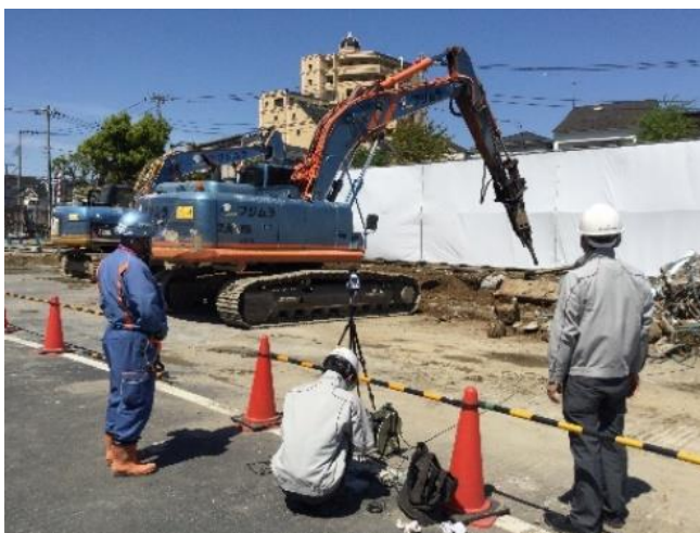
振動シミュレーション解析

解体作業は細心の注意を払い、低騒音・低振動の重機を使用し、少しでも振動を低減するよう以下の対策を講じてまいります。