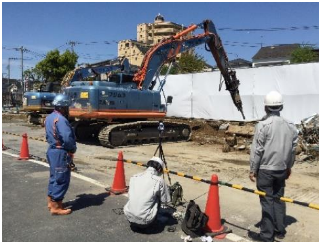
振動シミュレーション解析

解体作業は細心の注意を払い、低騒音・低振動の重機を使用し、少しでも振動を低減するよう以下の対策を講じてまいります。