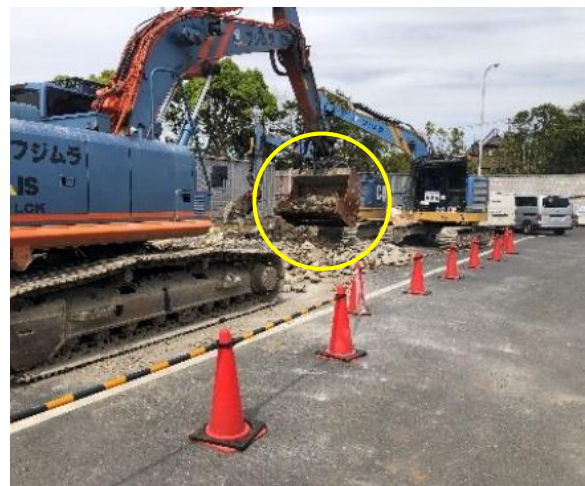
振動防止ふるいの採用